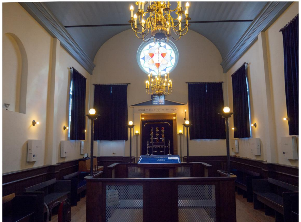
De Alkmaarse sjoel in ochtendlicht

Uiteraard blijven de gewone zaken niet liggen want de SAS probeert zo goed als mogelijk haar rol te vervullen als Joods centrum in de kop van Noord-Holland. Zoals u zult lezen was de SAS weer bij allerlei activiteiten betrokken. Daarnaast informeren wij u graag over de op stapel staande activiteiten.